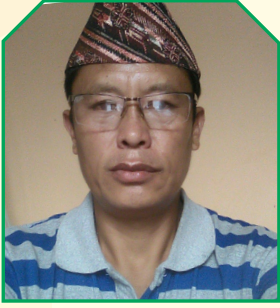
ग्रेस पुन कार्यक्रम निर्देशक मुख्यमन्त्री शैक्षिक सुधार कार्यक्रम लुम्बिनी प्रदेश

विद्यालयमा समतामूलक पहुँच, गुणस्तर एवम् आन्तरिक क्षमतामा सुधार गर्न विशेषगरी आधारभूत तहका विद्यालय तथा बालविकास केन्द्रहरूमा मुख्यमन्त्री शैक्षिक सुधार कार्यक्रम लागु गरेर विद्यालयहरूको भौतिक अवस्था तथा शैक्षिक गुणस्तरमा थप सुधार गर्ने उद्देश्यका साथ लुम्बिनी प्रदेश सरकारले आ.व. २०७८/०७९ को निम्ति १२वटै जिल्लाका सबै स्थानीय तहको गाउँपालिका, नगरपालिका र उपमहानगरपालिकामा क्रमशः ६० लाख, ७० लाख र ८० लाख बजेट विनियोजन गरेको छ। उक्त कार्यक्रम कार्यन्वयन पश्चात लक्षित वर्गमा उपलब्धमूलक र परिणाममुखी नतिजा प्राप्त हुने अपेक्षा गरिएको छ।