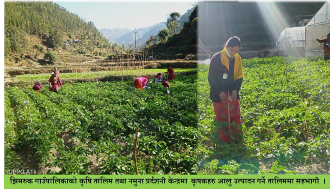
झिमरुक गाउँपालिकाको कृषि तालिम तथा नमुना प्रदर्शनी केन्द्रमा कृषकहरू आलु उत्पादन गर्ने तालिममा सहभागी ।