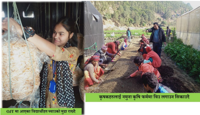
कृषकहरूलाई नमुना कृषि फर्ममा विउ लगाउन सिकाउदै