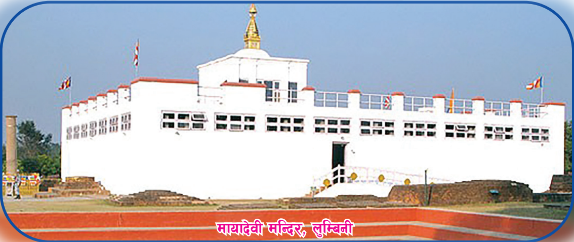
मायादेवी मन्दिर, लुम्बिनी