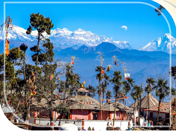
स्वर्गद्वारी मन्दिर, प्यूठान