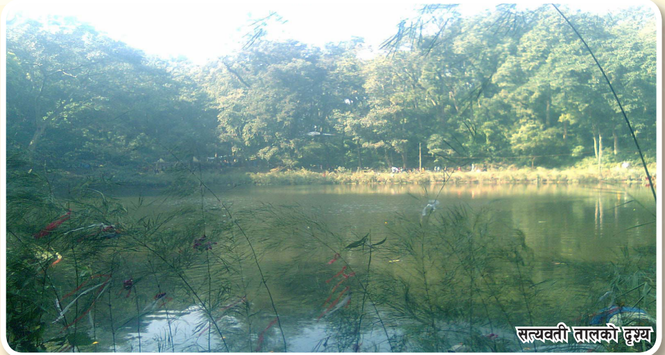
सत्यवती तालको दृश्य