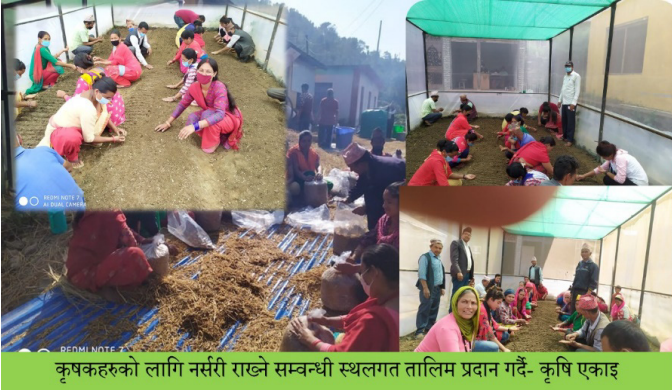
कृषकहरूको लागि नर्सरी राख्ने सम्बन्धी स्थलगत तालिम प्रदान गर्दै- कृषि एकाइ