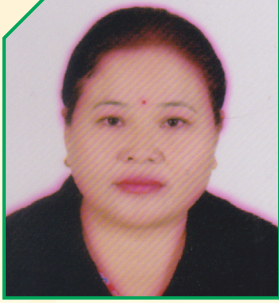
विष्णु माया थापा मगर सदस्य-प्रदेश योजना आयोग